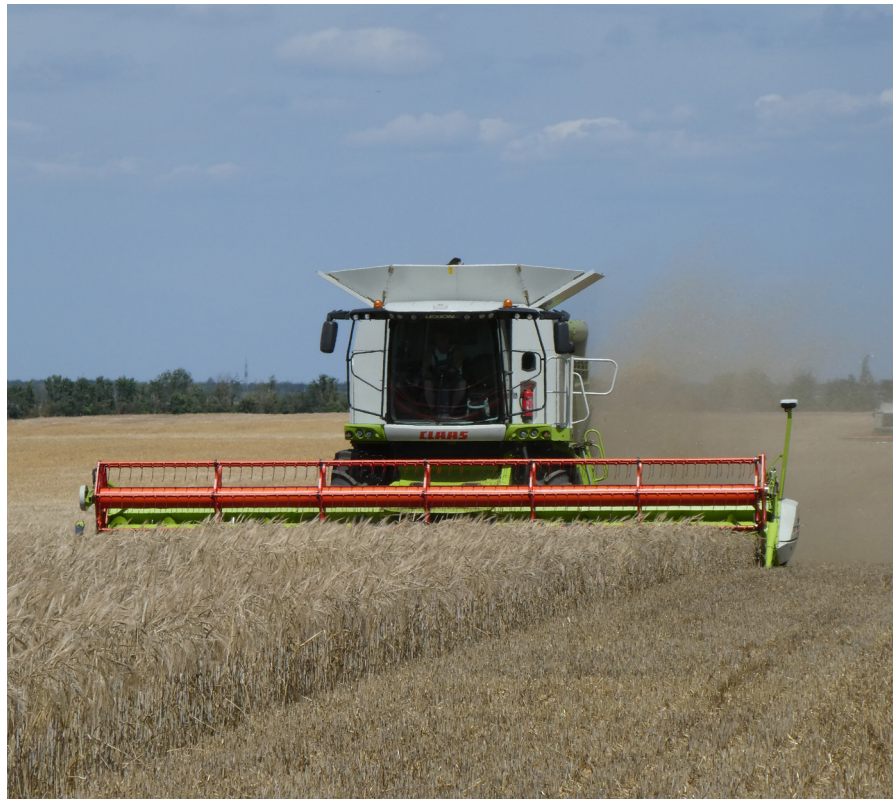
Drusch der Wintergerste im Kreis Anhalt-Bitterfeld

Olaf Feuerborn, Präsident des Bauernverbandes Sachsen-Anhalt e.V., sieht