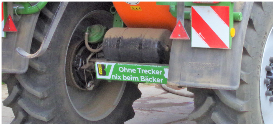
Die Aufkleber lassen sich natürlich für verschiedenste Technik verwenden.

Rund 200 Aufkleber mit dem Slogan "Ohne Trecker nix beim Bäcker" sind bereits in Sachsen-Anhalt unterwegs, an Anhängern, Schleppern und anderer Technik. Die Aufkleber sind wetterfest und UV-beständig, mit jeder Fahrt können Sie darauf hinweisen, dass Landwirtschaft im Dienste aller unterwegs ist. Alle Informationen dazu finden Sie unter www.bauernverband-st.de .