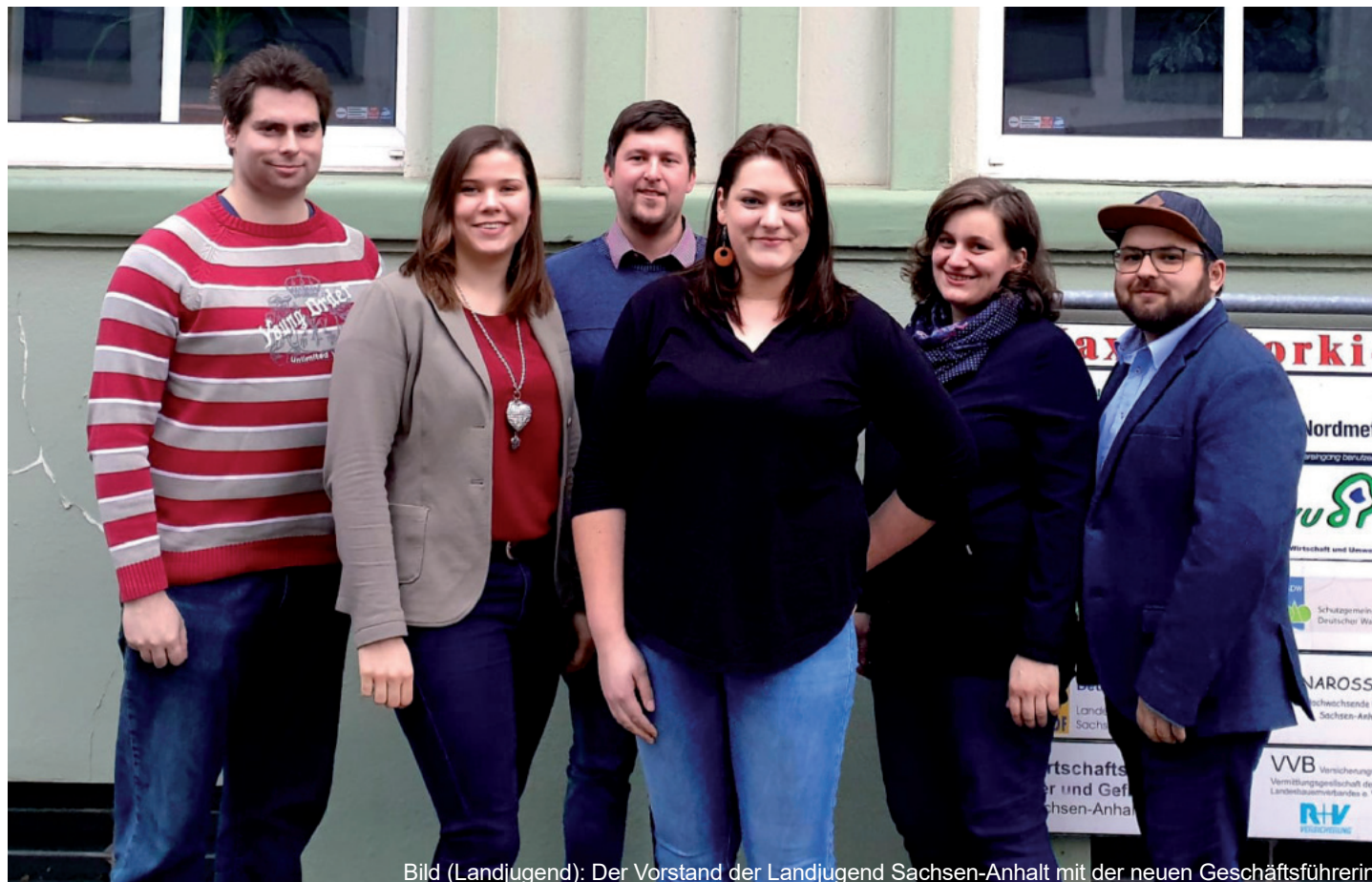
Der Vorstand der Landjugend Sachsen-Anhalt mit der neuen Geschäftsführerin