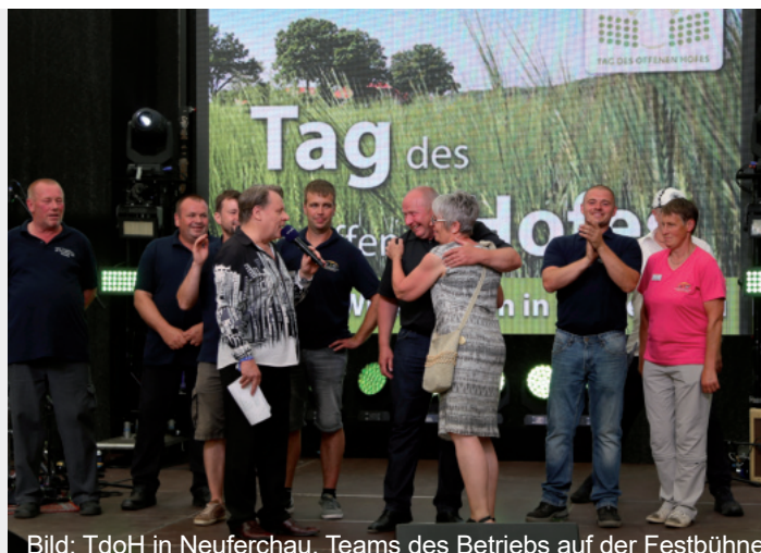
Bild: TdoH in Neuferchau, Teams des Betriebs auf der Festbühne