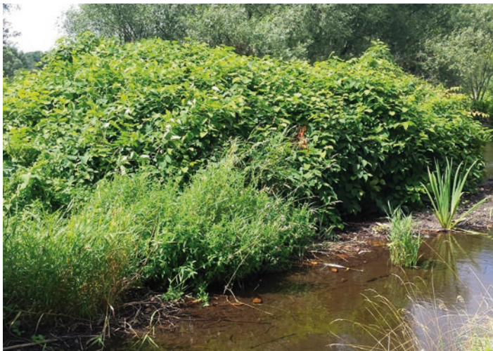
Die Staudenknöteriche sind bereits an vielen großen und kleinen Flussläufen verbreitet. Die Auswirkungen auf landw. Nutzflächen zeigen sich vorrangig im Grünland.