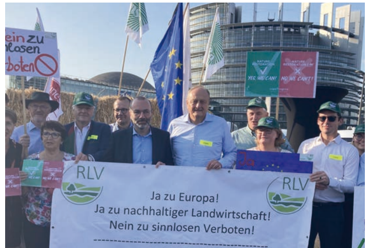
Bild (DBV): DBV-Präsident Joachim Rukwied und weitere Demonstranten in Straßburg im Juli 2023.

Nach Berechnungen des Leibniz Instituts für ökologische Raumforschung sind von der SUR in Deutschland 31 % der Ackerfläche und 36 % der Obst- und Weinbaufläche betroffen. Im Ackerbau belaufen sich die prognostizierten Ertragsverluste beim Wintergetreide auf ca. 30 %, bei den Kartoffeln