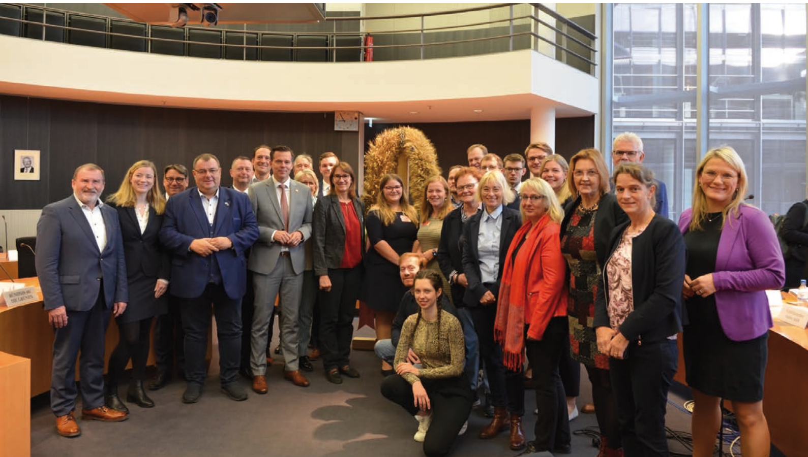
Bild (BDL): Mitglieder der Landjugend und Mitglieder des Bundestagsausschusses.