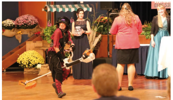
Bild: Hexe Griseldis unterstützte die Auflösung der Tombola.