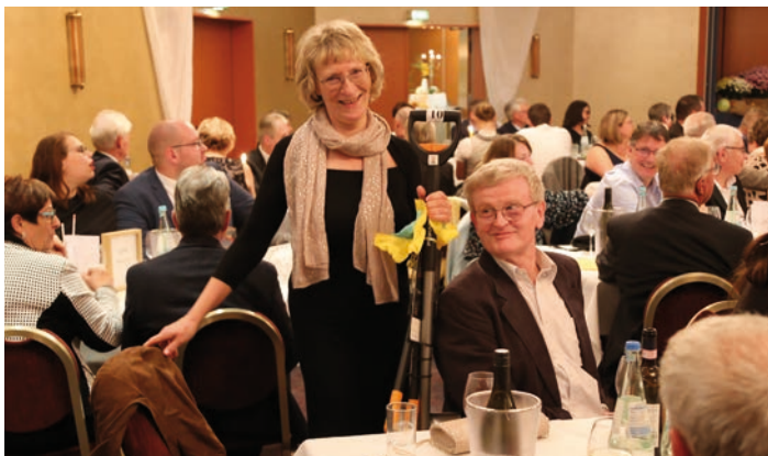
Bild: Glückliche Gewinner der Tombola.