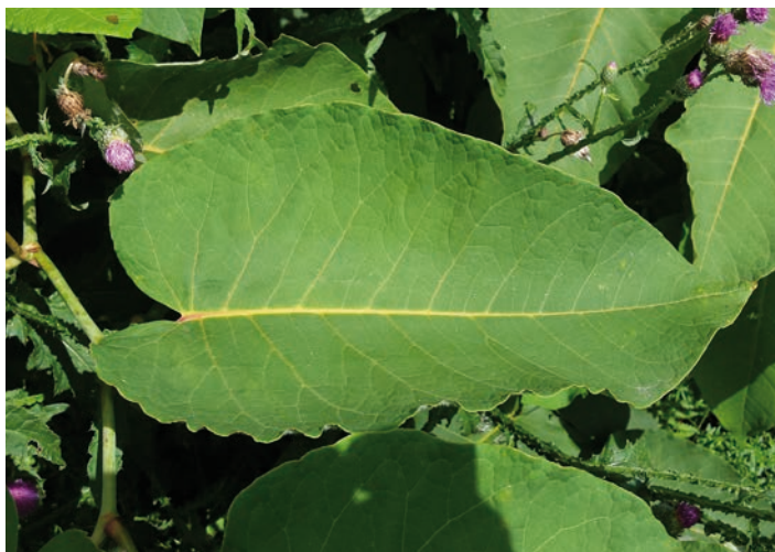
Bilder (Antje Birger): Die drei Arten können an der Blattform unterschieden werden, oben der Sachalin-Staudenknöterich. Blütenstände sind weiß und entspringen den Blattachseln.

Die Gattung Staudenknöterich Fallopia gehört zur Klasse der Zweikeimblättrigen (Dicotyledoneae) und zur Familie der Knöterichgewächse (Polygonaceae).