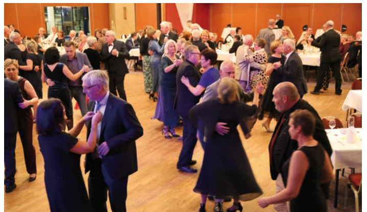
Bild: Ein guter Musik-Mix animierte zum Tanz.